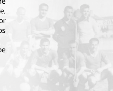
A valerosa equipa formada por alguns dos melhores internacionais que tomou parte na festa de Artur de