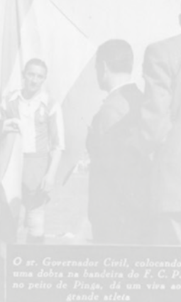
O sr. Governador Civil, colocando uma dobra na bandeira do F. C. P. no peito de Pinga, dá um viva ao grande atleta.