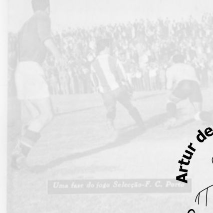
Uma fase do jogo Seleção-F. C. Porto.