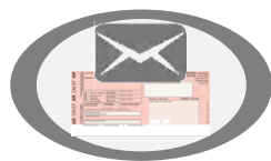
Receção AR e devolvidos