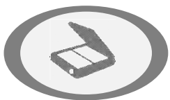
Digitalização e captura de código Registo

Distribuição de correspondência no domicílio de Clientes, com recolha de assinatura de quem recebe o objeto, para o Correio Registado com AR. No decorrer da distribuição pode haver correspondências a devolver ao remetente.